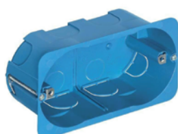
Incasso - Built-in