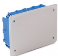
Derivazione - Derivation